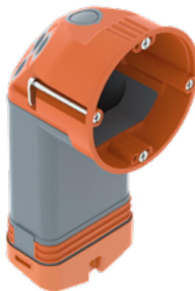
Tip: HE 74-L Br. art. 2003828